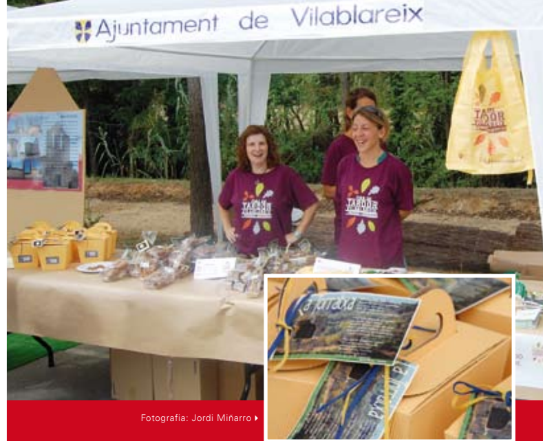
Fotografia: Jordi Miñarro