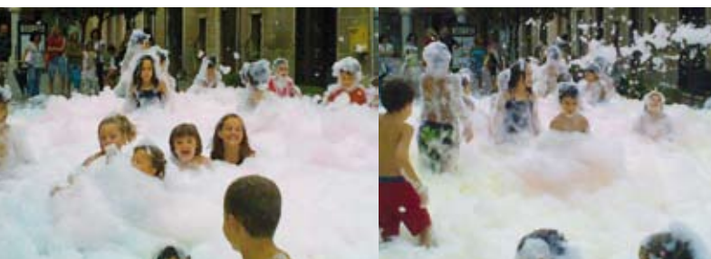
Fotografies: Local de joves

Vam fer un intent frustrat el dia 1 d'agost a l'exterior del local de joves, però un vent fort s'en-duia l'escuma i suposem que també la gent que venia, ja que només una desena de persones