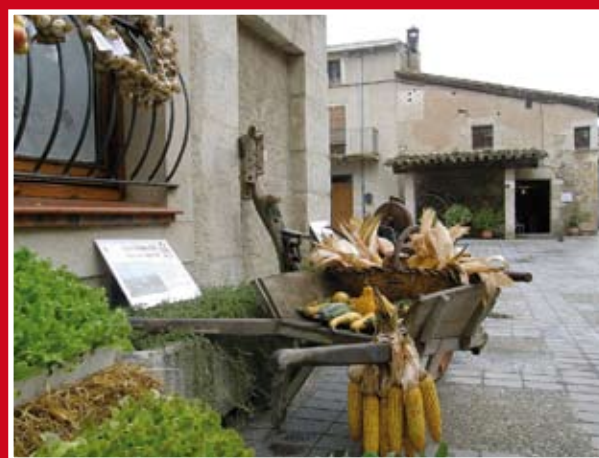
3r premi CARRO Lluís Soler Llavaneras Borrassà