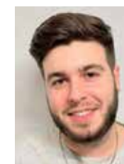
Adrià Parés Disseny gràfic