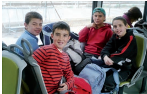
▲ L'arribada a Núria, amb cremallera, és molt més emocionant que l'autocar de les altres excursions.