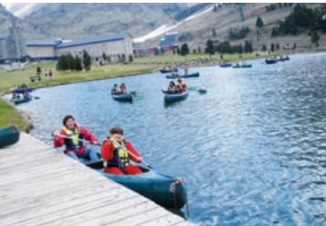
▲ Un entorn privilegiat per gaudir dels esports, la natura i la convivència amb els companys.