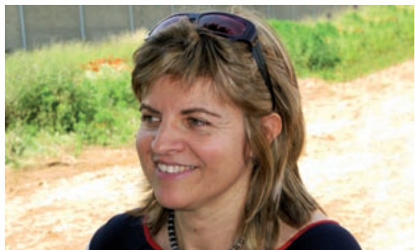
Fraser & Sureda Comunicació

- Ben poca, de moment. Fins ara havia vingut a trobades amb companys en un restaurant. També vaig venir fa anys al CEIP Madrenc a fer una xerrada com