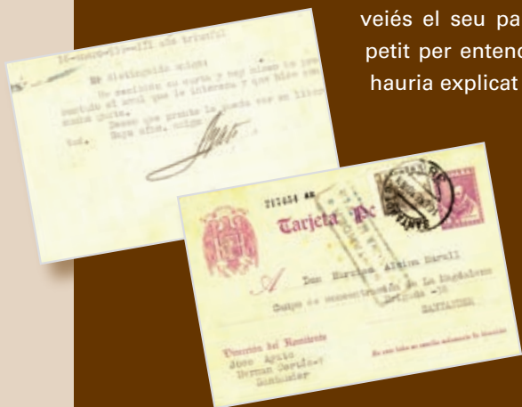
Targeta del camp de concentració de Santander.