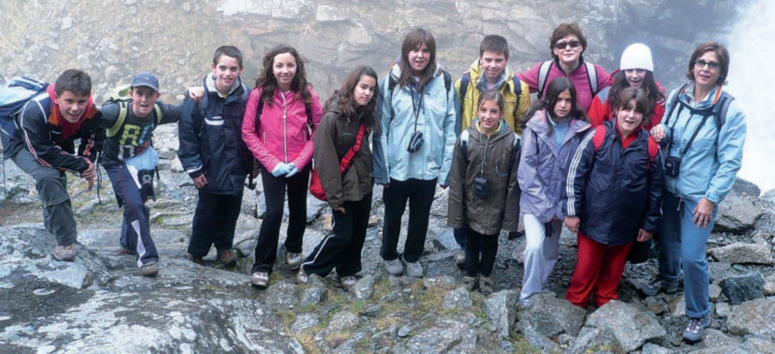
▲ Caminada de Queralbs a Núria. Uns monitors molt trempats explicaven la fauna i la flora, i van tenir la sort de veure molts isards.