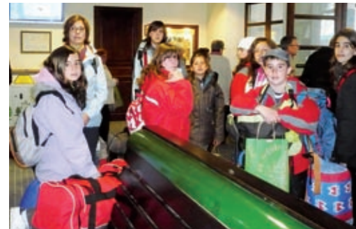
▲ Adéeeeu! Final de curs, final d'etapa, final d'escola.