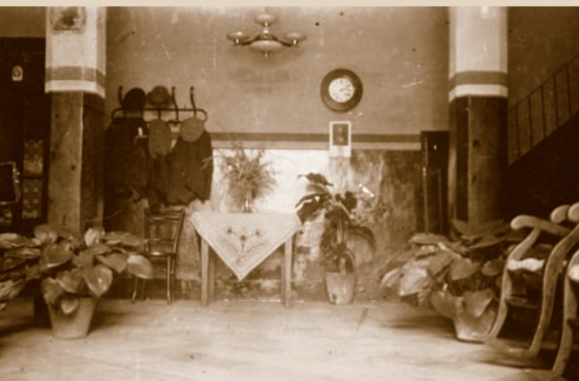
▲ L'entrada de Can Mau, actual vestíbul de l'Ajuntament.