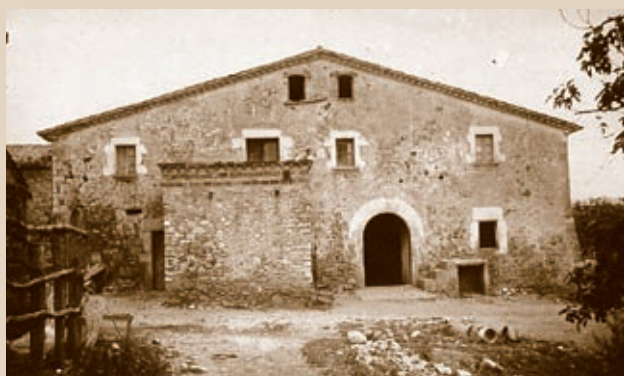
▼ La casa pairal de la família Alsina, can Raset.