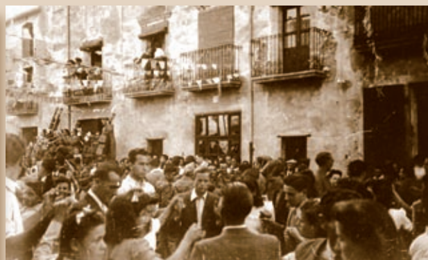
▼ Balcons de Can Mau, a la plaça del Perelló, guarnits per la Festa Major.