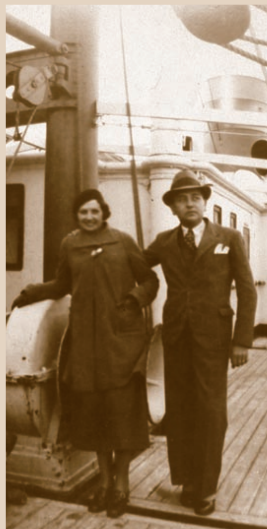
▲ Viatge de nuvis a València, a punt de pujar al vaixell (1935).