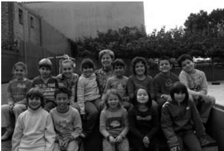
Alumnes CEIP Madrenc de 3er