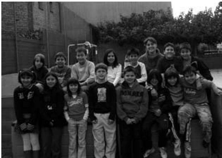
Alumnes CEIP Madrenc de 4rt