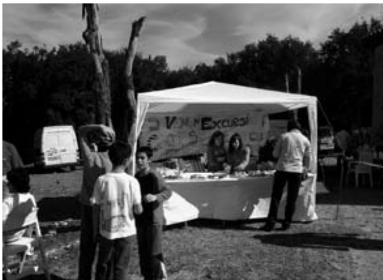
Alumnes de 6e del CEIP Madrenc venent coques a l'Aplec

exigides per la seva posterior incorporació al mercat de treball normalitzat, objectiu principal del programa. Aquest programa depèn de Càritas i inclou diferents serveis, entre ells el de Muntatge Industrial de Bicicletes i el de Quadres Elèctrics, els quals es troben ubicats a la nostra població, c/ Güell (Perelló). El dia 16 de desembre passat, un grup de rectors de l’Arxiprestat de Girona-Salt (que inclou també