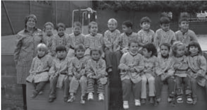
Alumnes CEIP Madrenc de P3