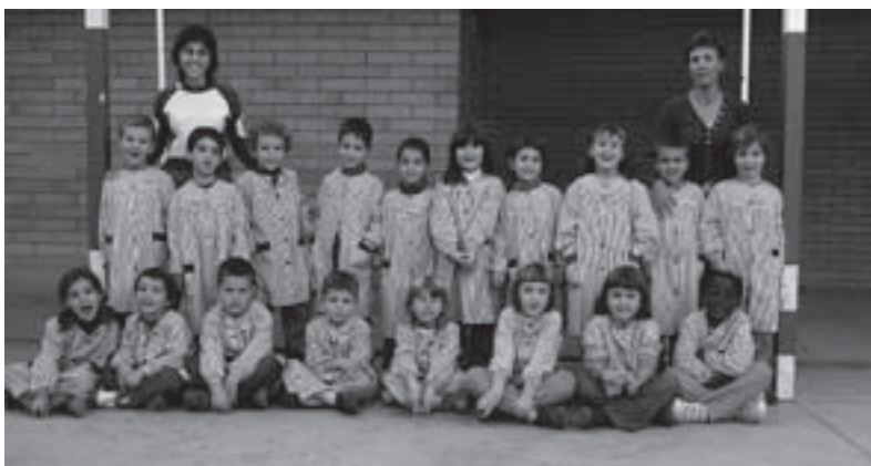
Alumnes CEIP Madrenc de P5