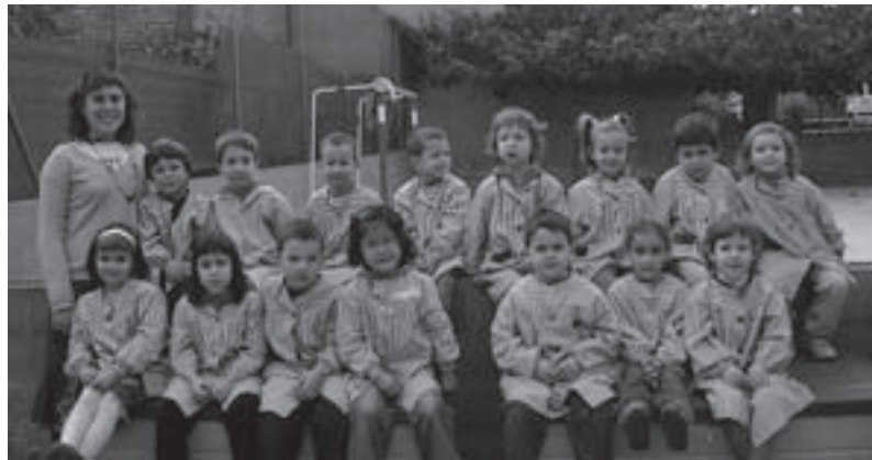
Alumnes CEIP Madrenc de P4