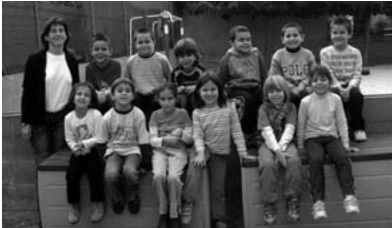
Alumnes CEIP Madrenc de 1er