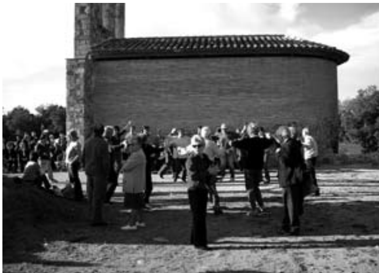
Sardanes a Sant Roc 2007 per Cobla Iluro

Seguint la tradició, el segon diumenge de Quaresma, que enguany s'escaigué el dia quatre de març, celebrarem el nostre conegut i típic Aplec de Sant Roc. Precedida i seguida d'altres actes festius, a les 12