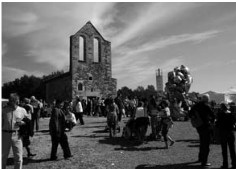
Aplec Sant Roc 2007

Suposo que així, d’entrada, aquest nom no diu res a la majoria d’habitants de la nostra Vila: i és una llàstima perquè es tracta de quelcom ben interessant. Per començar direm que ECOSOL (Economia Solidària) és un programa d’inserció sociolaboral que ofereix espais reals de treball a persones amb dificultats d’inserció per tal que el/la participant assoleixi els hàbits, les habilitats, la responsabilitat i la qualitat laboral