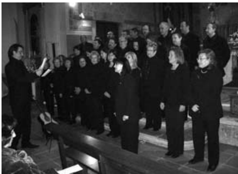
Coral del GEiEG oferint Concert de Nadal 2006 Sant Esteve

vostre retorn, Senyor Jesús". Com a signe extern d'aquesta "vinguda", vam col·locar la "Corona d'Advent" al presbiteri de l'església parroquial; no és obligatori fer-ho, però inclou una forta càrrega pedagògica, ja