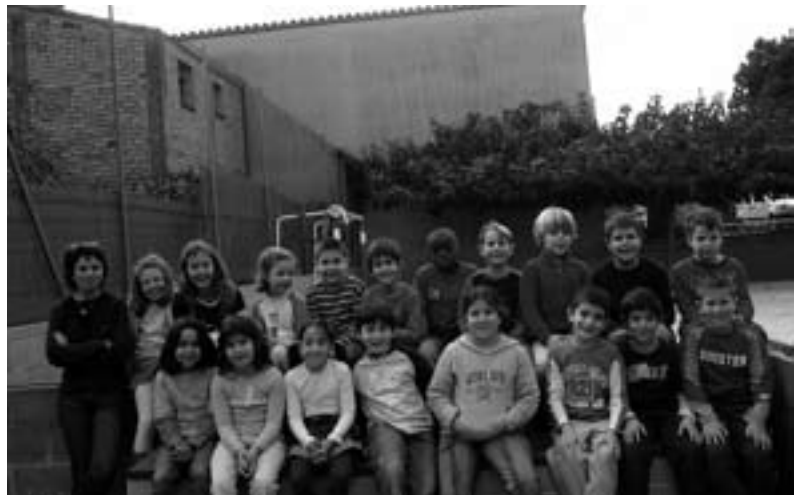
Alumnes CEIP Madrenc de 2on