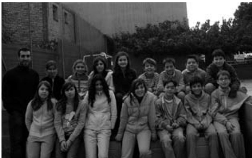
Alumnes CEIP Madrenc de 6é