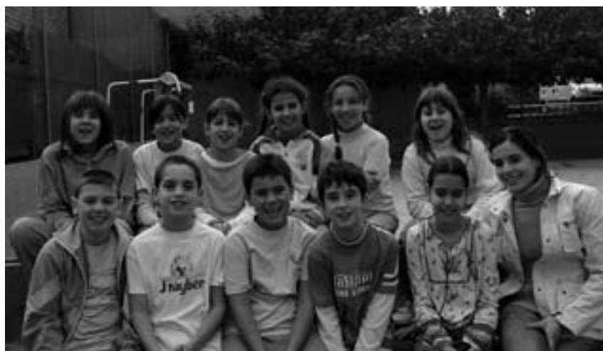
Alumnes CEIP Madrenc de 5é