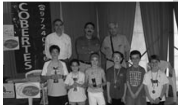
Els 6 primers classificats del torneig de tennis taula benjamí-aleví.