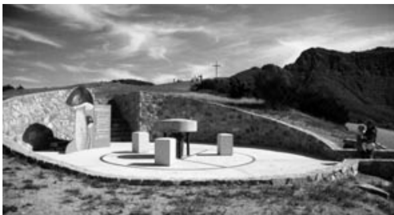
La Taula dels Tres Bisbes

Arribem a Collformic, el punt més alt de la carretera de Seva i el Brull a Sant Esteve de Palautordera. És el moment, si estem en forma, de fer una caminada i arribar fins a la creu del Matagalls, un altre dels llocs emblemàtics del nostre Montseny.