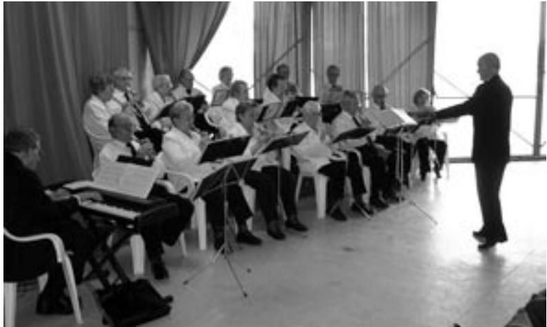
Components del concert de flautes dolces

Finalment, es pot qualificar d'acceptable l'assistència a l'obra de teatre de Miquel Mihura "Préssec en almívar", representada per "L'Agrupació Teatral Benet Escriba", de Sant Feliu de Guíxols.