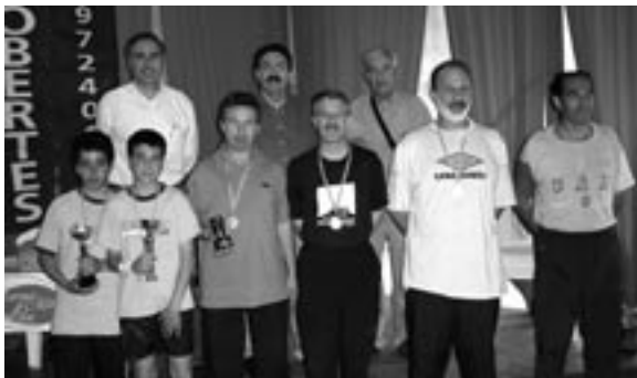
Els 6 primers classificats del torneig tennis taula, d'infantil-senior.