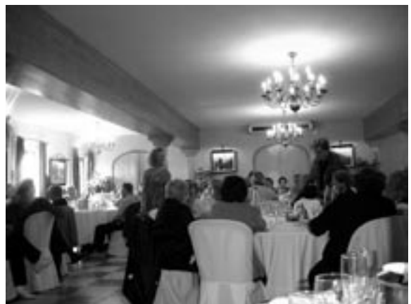
Després del dinar un show de varietats

panyament de la coral del GEiEG, que a continuació va oferir un concert on va interpretar les següents cançons: "Signore delle Cime", "L'hereu Riera", "Agur jaunak", "Rossinyol", "Ay agüita de mi tierra", "Balñao", "La sirena de Begur", "The Lion Sleeps Tonight" i "Siyahamba".