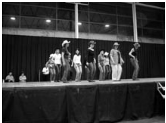
Un del grup de country.