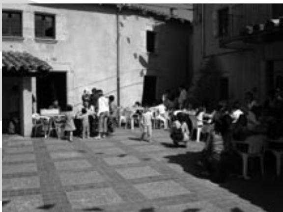
Més de 100 participants al concurs de dibuix.