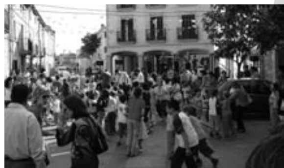
Petits i grans participants a la festa.