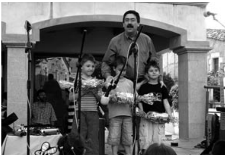
Guanyadors del concurs de dibuix de 6 a 8 anys.