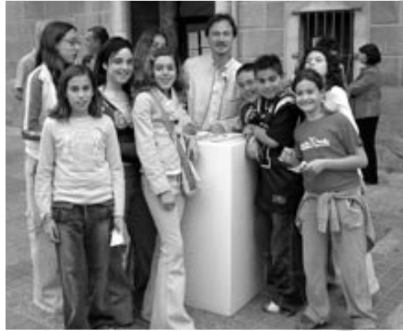
En Martí, signant autògrafs al jovent del poble.

Però tota aquesta descripció poètica però sincera no seria res si no estigués habitada per vosaltres, homes i dones d'aquesta terra gironina. No en tinc cap dubte que estimeu les vostres arrels, però ara sé que vénen temps difícils, que dubtareu del camí que heu d'agafar, que haureu de compartir aquesta pau amb d'altres que vindran de fora atrets per la tranquil·litat que aquí sempre heu gaudit. Doneu exemple d'allò que voleu ser, marqueu les vostre