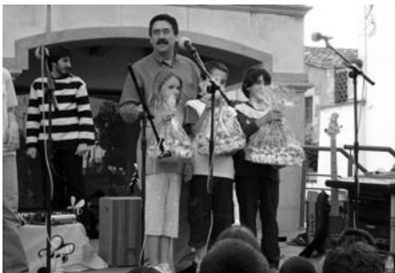
Guanyadors del concurs de dibuix de 9 a 11 anys.