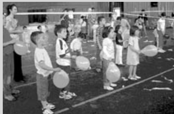
Els nens i nenes durant l'espectacle del grup d'animació infantil "Vatua l'Olla".

A banda de la distribució dels cubells, que ha centrat la campanya en els últims mesos, els educadors han realitzat i/o participat en altres activitats. Així, es van portar els alumnes de l'escola Madrenc a veure la mostra de productes reciclats del Departament de Medi Ambient i Habitatge, i hi van fer jocs. També el Consell Comarcal va participar en la festa major del nostre poble. El dia 16 de maig es va instal·lar un estand en el pavelló municipal i un expositor sobre reco-