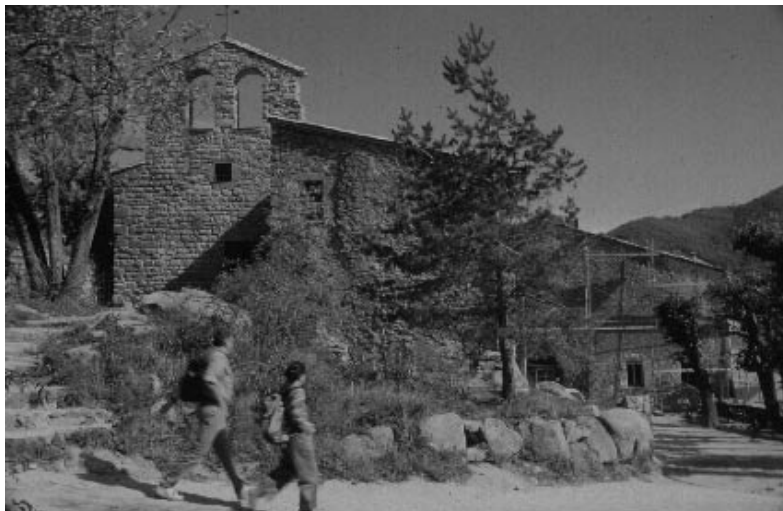
Antic monestir de Sant Marçal, actualment convertit en restaurant

Ben a prop hi trobarem l'Escola de la Natura de Can Lleonard, on podem veure una exposició permanent que ens