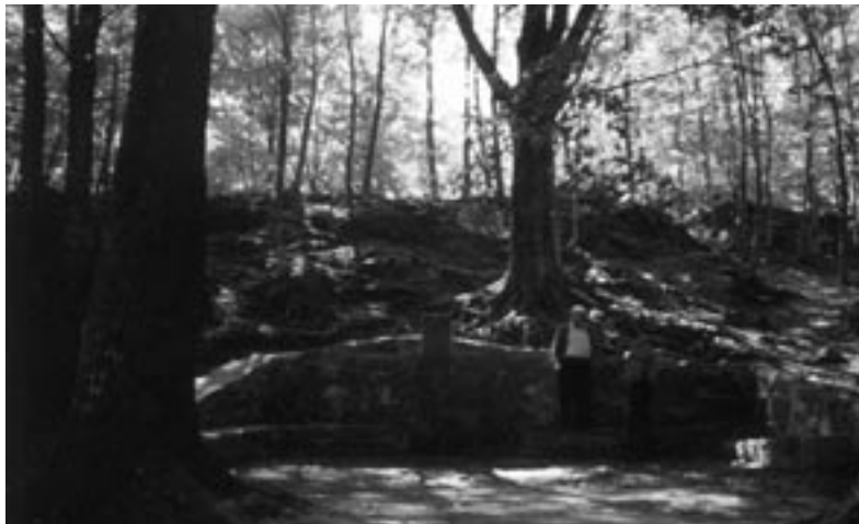
Font Bona, inici del riu la Tordera.

Deixem aquest niu d'àguiles i baixem fins al poble que porta el nom del massís, Montseny. És un poble petit, molt bonic, on lògicament es té una atenció especial als visitants, que són milers cada any. Per això hem de dir que hi ha hotels i res-