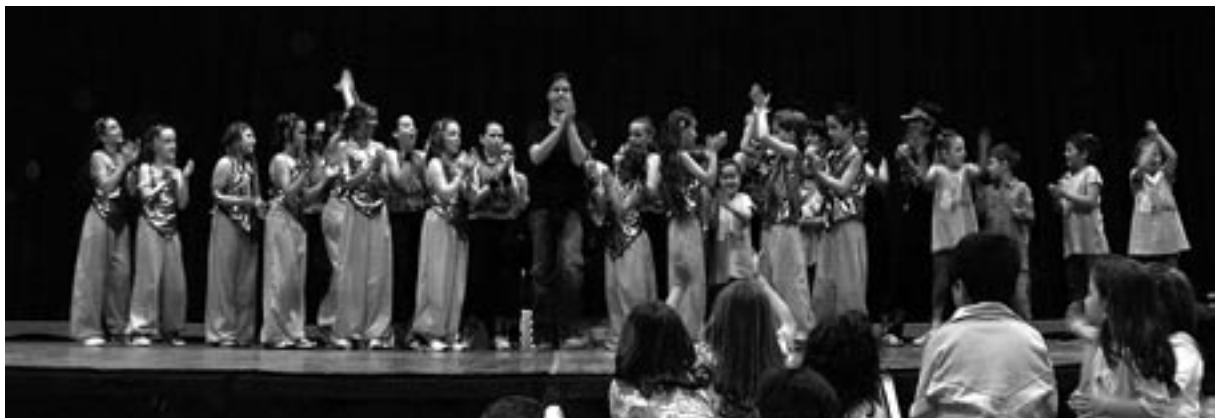
L'Eva amb els participants de l'exhibició de funky.