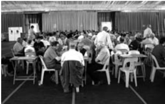
Concentrats tot jugant a la botifarra.