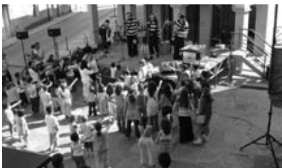
L'animació infantil amb el grup la Tresca i la Verdesca.