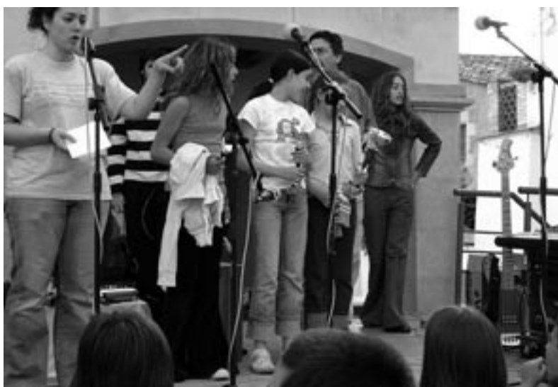
Guanyadors del concurs de dibuix de 12 a 14 anys.