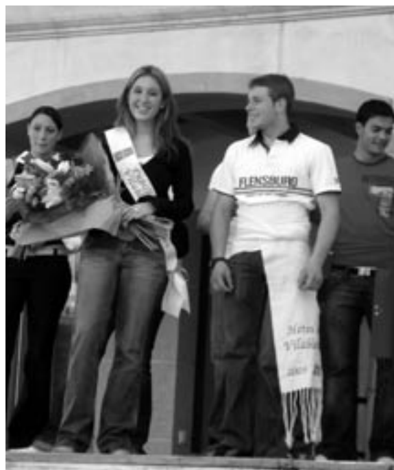
Elecció de l'hereu i la pubilla 2005

La ludoteca restarà tancada els dies: 29 i 31 d'octubre i 24 i 31 de desembre de 2005 i 7 de gener de 2006.