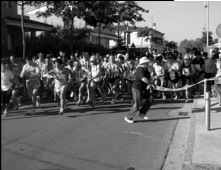
Sortida de la XV Marxa Popular de Sant Roc