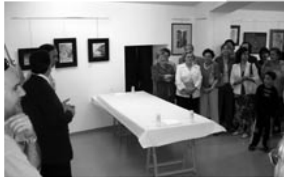
Inauguració de l'exposició d'art.