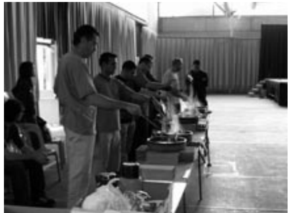
Tot cremant el rom.