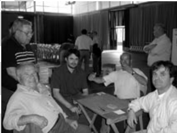
Finalistes del Campionat de Botifarra.