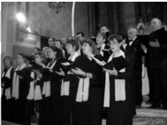
La coral Sol Ixent en el concert del dia de la festa de la gent gran