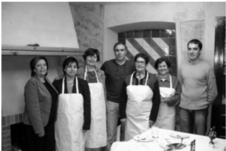
Jurat, participants amb davantal i el regidor en el concurs de pastissos.