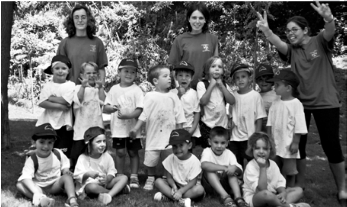
A dalt: Grup dels ratolins del Casal d'es- tiu.