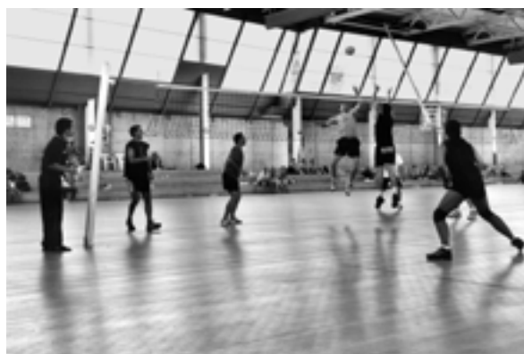
Un dels partits disputats en el decurs del torneig.