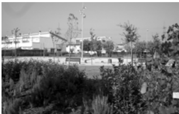
La nova plaça, que es troba situada entre els carrers La Vinya i Pirineus.