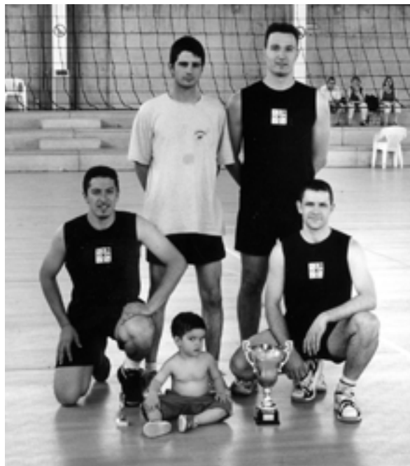
Jugadores dels Trabucaires , l'equip guanyador de les primeres 24 hores de Vilablareix, amb el corresponent trofeu.

Finalment, l'equip de mini-volei encara s'està formant, ja que la seva lliga comença més endavant. Esperem que aquesta temporada es compleixin les previsions de tots els equips i que tot vagi sobre rodes.