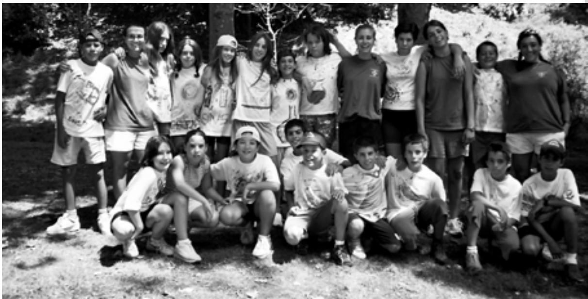
A sota: Grup dels eins22 del Casal d'estiu.