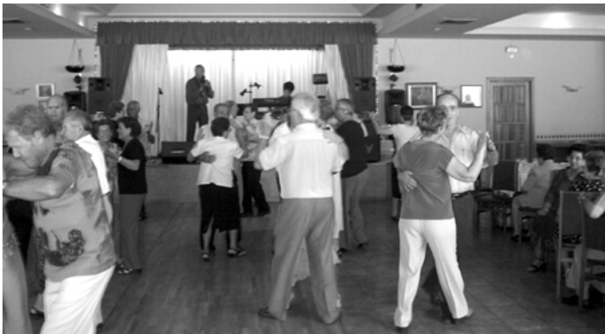
Fi de festa del XII aniversari de la Llar de Jubilats.