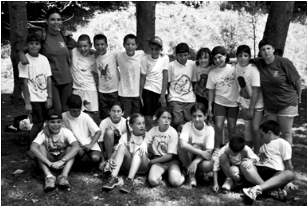
A l'esquerra: Grup dels detec- tius del Casal d'estiu.