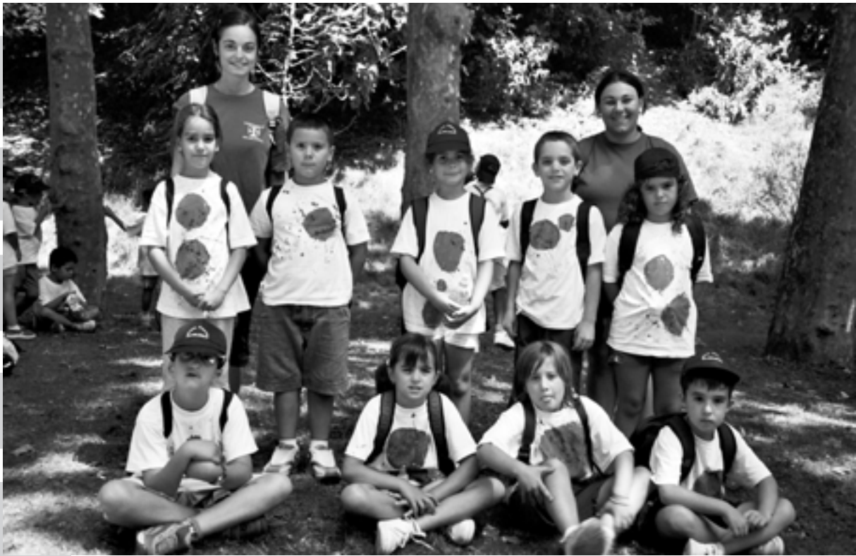
A dalt: Grup dels grans-inventors del Casal d'estiu.