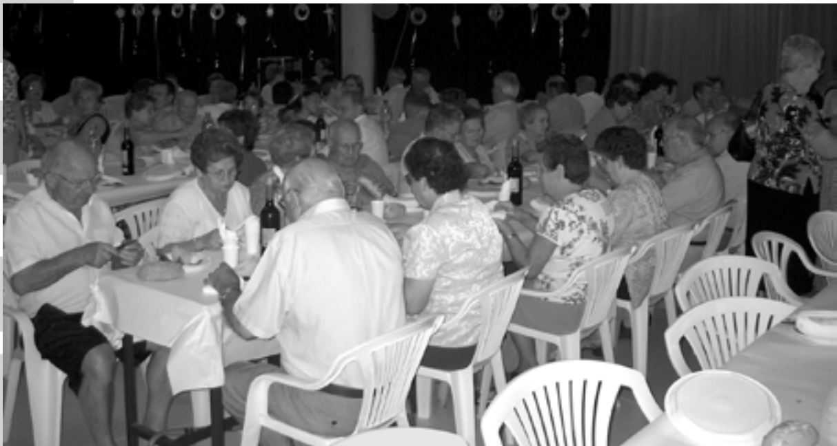
Berenar-sopar organitzat per la Llar de Jubilats el 4 de juliol.