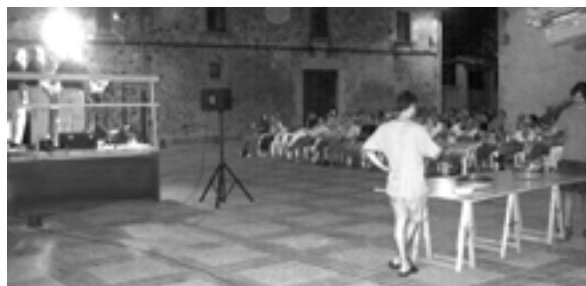
Fent el cremat que es va repartir entre els assistents a la cantada d'havaneres.

amb les altes temperatures que s'han registrat aquest estiu, i que han fet que a la fresca s'hi estigués molt bé.