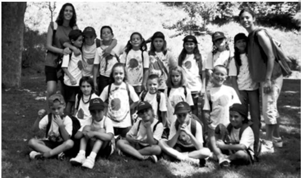
A la dreta: Grup dels robots del Casal d'estiu.