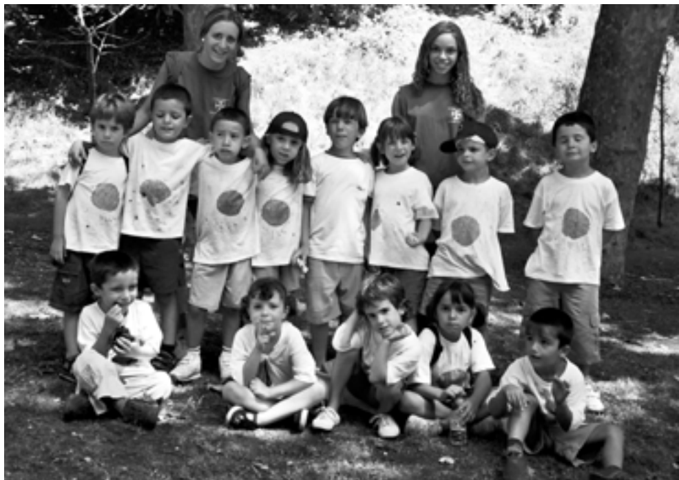
A la dreta: Grup dels inventors del Casal d'estiu.

Així doncs, el Casal de Vilablareix es va convertir en un centre d'investigació. I mica en mica, ens vam anar endinsant en el món de la ciència.