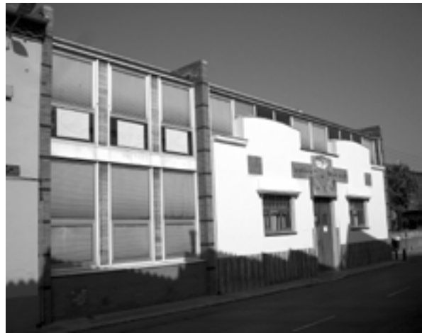
L'escola amb la cara neta.