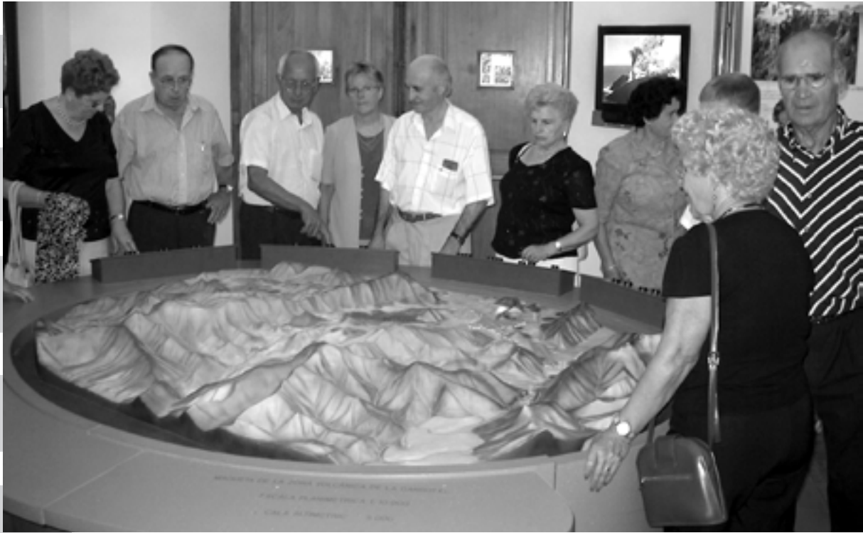
Socis de la Llar de Jubilats visitant el Museu dels volcans d'Olot.

Val a dir que, abans del ball, l'Ajuntament ens va obsequiar amb unes fotografies emmarcades que registraven diversos moments de l'espectacle celebrat el dia 4 de juliol.