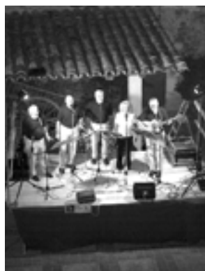
El grup d'havaneres Quart creixent en un moment de l'actuació programada en els Dijous a la fresca d'enguany.

Aquest estiu, la participació ciutadana en els actes programats dins els "Dijous a la fresca" ha estat molt satisfactòria.