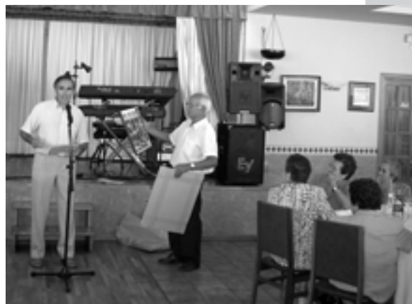
L'Ajuntament va fer entrega a la Llar de Jubilats d'un record de l'activitat celebrada el 4 de juliol.

Finalment, en l'apartat de precs i preguntes va haver-hi una xerrada-col·loqui entre la junta i l'Assemblea en el decurs de la qual el president va recordar que, d'acord amb els Estatuts de l'entitat, s'han de celebrar eleccions, lliures i secretes, per escollir una nova junta dins l'actual exercici.