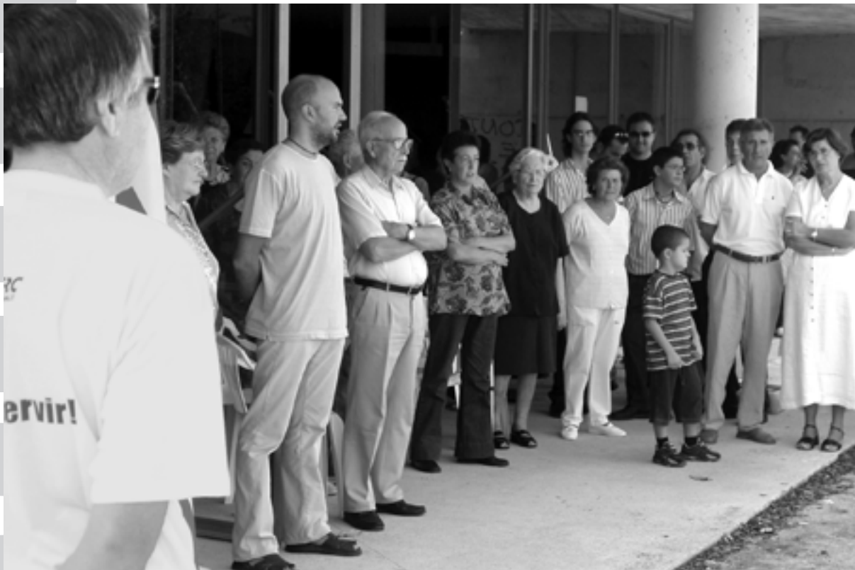
La Diada Nacional de Catalunya a Vilablareix.

El passat dijous dia 11 de setembre vam celebrar per primera vegada a Vilablareix la Diada Nacional de Catalunya.