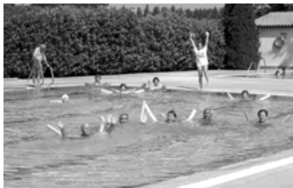
La gent gran de Vilablareix fent l'activitat de manteniment a la piscina.

M'agradaria aclarir, als infortunats veïns anònims, la raó per la qual no es va obrir durant tot el dia,