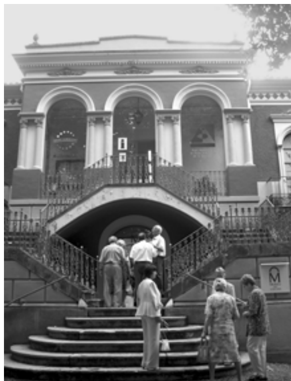
Al Museu dels volcans d'Olot.

Després els autocars ens traslladaren al restaurant Can Xel, on va seguir la festa d'aniversari amb un dinar i un ball amenitzat pel duet " Bora Tuna ".