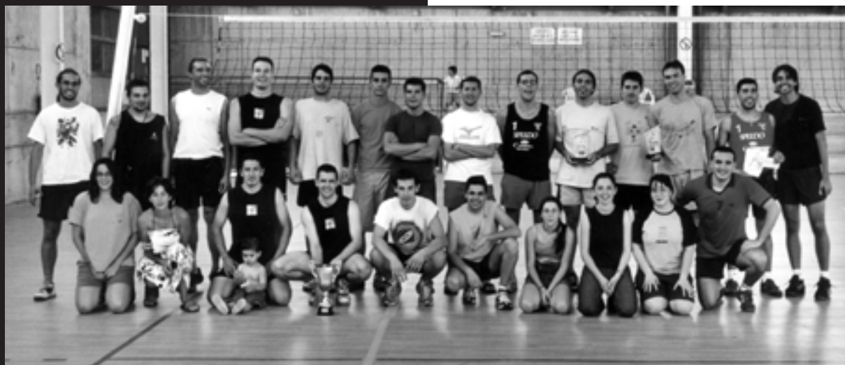
Tots els guanyadors i els membres de l'organització del torneig.