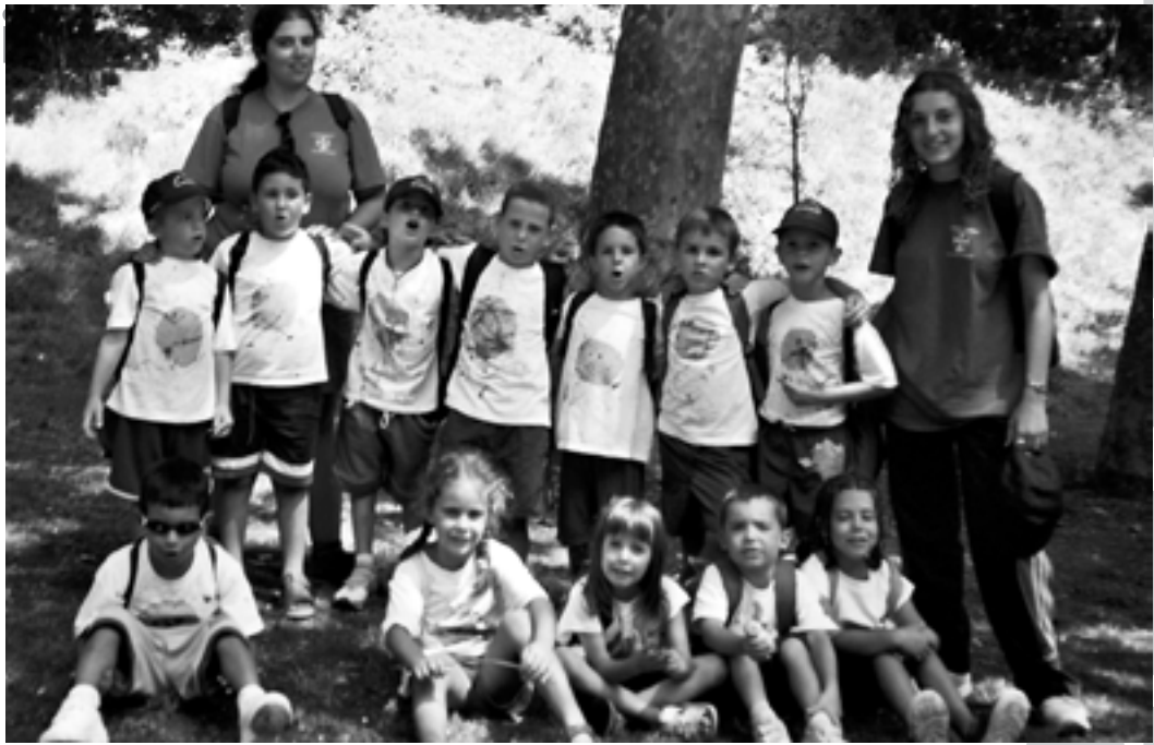
Grup dels petits-científics del Casal d'estiu.