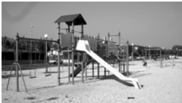
Jocs del Passeig Catalunya.

Es tracta de jocs dels quals en podran gaudir tant els nens petits com els més grans i les zones on s'han instal·lat són les següents: el Passeig Catalunya, l'exterior del pavelló poliesportiu, la zona verda situada entre els carrers Pont d'en Canals i La Crosa i la nova plaça abans esmentada.