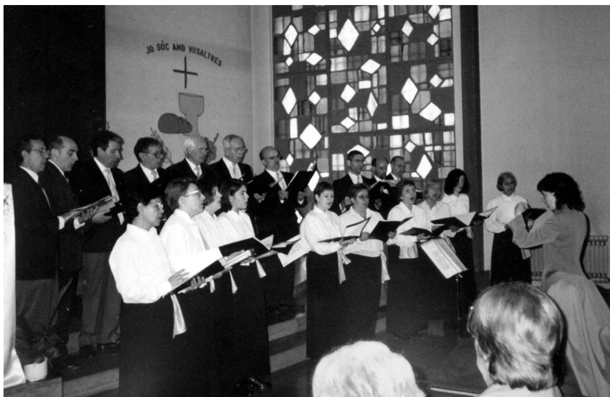
La coral Les Alzines va acompanyar l'ofici solemne i va oferir un concert per la Festa Major.

No cal dir que, en acabar, una pluja de sincers i sonors aplaudiments sotasignaren la magnífica actuació de l'esmentada coral. Per a molts anys!