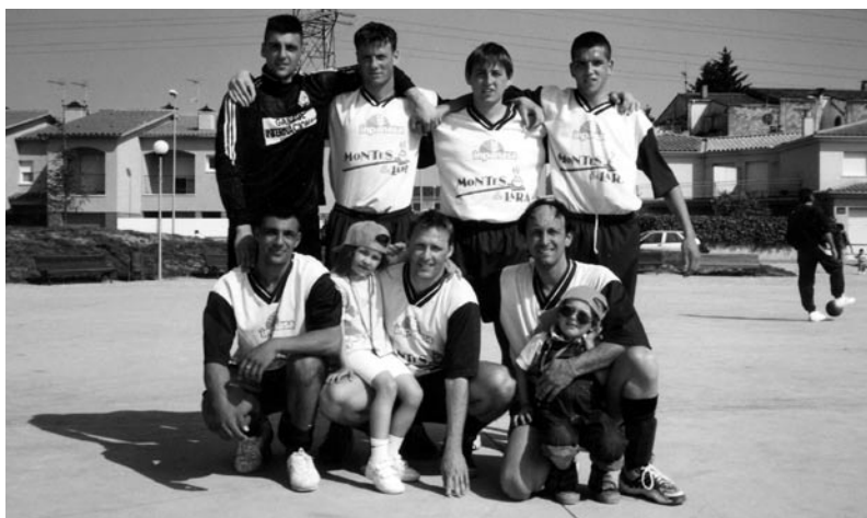
L'equip de l'Impanasa, finalista del torneig de futbol sala.