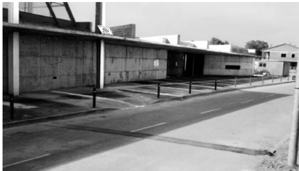
Part del pavelló poliesportiu on es fan les obres de la 2a fase del projecte.