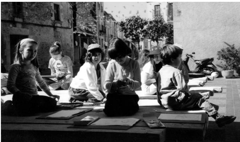
Participants en el XVIII Concurs de dibuix lliure.