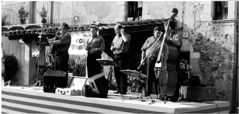
Havaneres amb el grup Terra Endins.