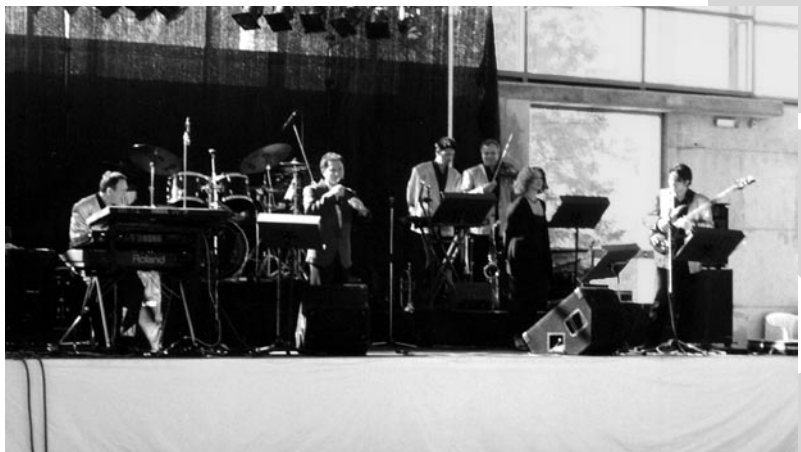
Setson & Blas i la Sandra van oferir un concert per a la gent gran i a continuació va haver-hi un ball per a tothom.