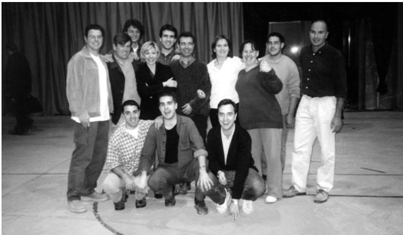
Alguns membres del JAV amb la Mari Pau Huguet.