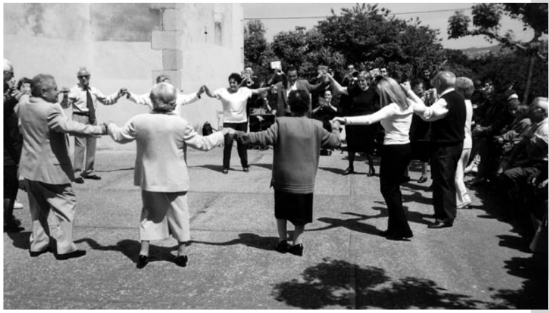
La cobla Rossinyolets interpretant sardanes a la Festa de la Gent Gran.