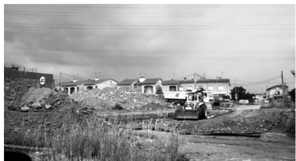
Les màquines treballant, per fi, a les rotondes.