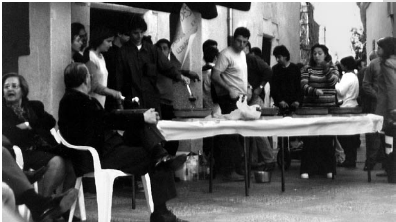
Membres del JAV fent el cremat que es va repartir entre els assistents a les havaneres.