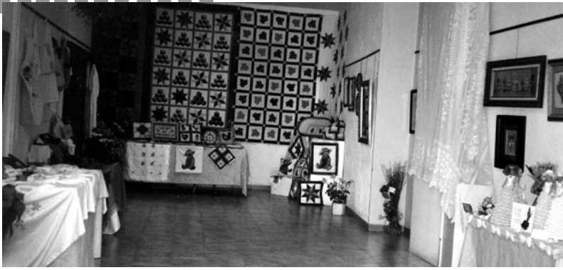
Exposició de treballs de patchword i punt de creu i de nines de paper a Can Gri.