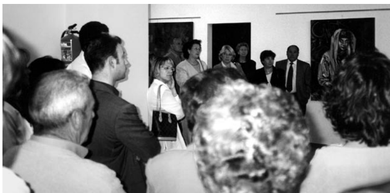
Inauguració de l'exposició col·lectiva d'art a Can Ballí.