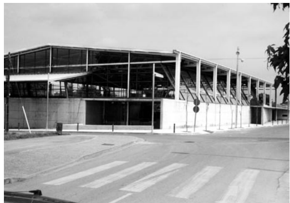
Aspecte actual del Pavelló poliesportiu municipal.