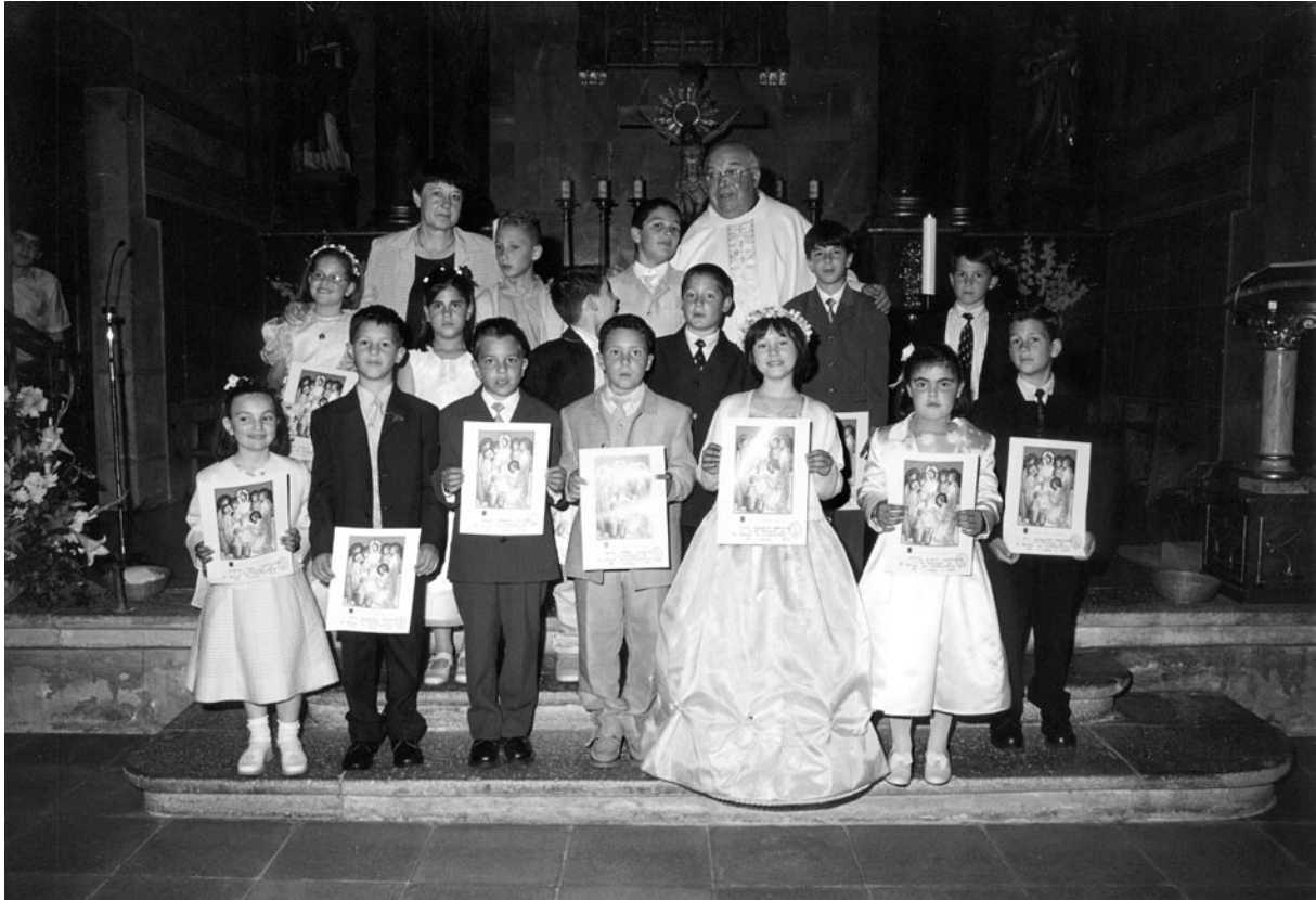
Els nens i nenes que van fer la Primera Comunió el diumenge 27 de maig de 2001.