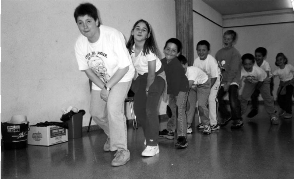
Per Setmana Santa la ludoteca es va convertir en ludo-casal.