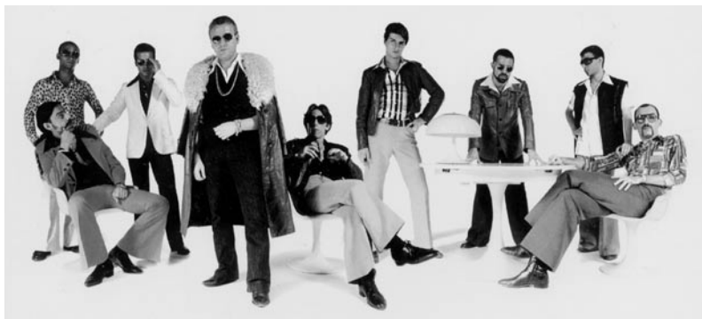
Fundación Tony Manero, un dels grups que va actuar a la Nit Jove.