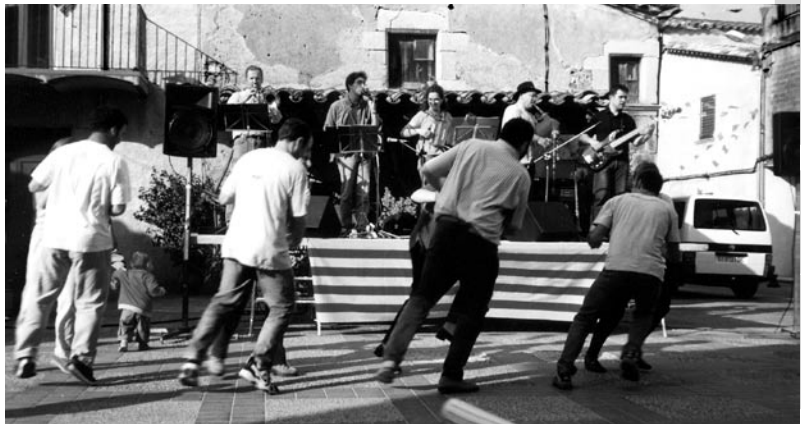
Dances tradicionals amb el grup Espigasons.