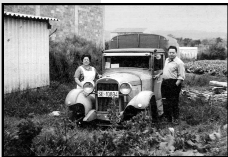
El matrimoni amb el cotxe que van comprar a finals de la dècada dels 60 per repartir el pa.

"Després de la bicicleta vaig repartir el pa durant dos anys amb una moto Montesa i més endavant, a finals de la dècada dels 60, ja vaig comprar un turisme de segona mà que vaig reconvertir en furgoneta", continua en Francesc, que comenta que aleshores només hi havia 3 cotxes en tot el poble