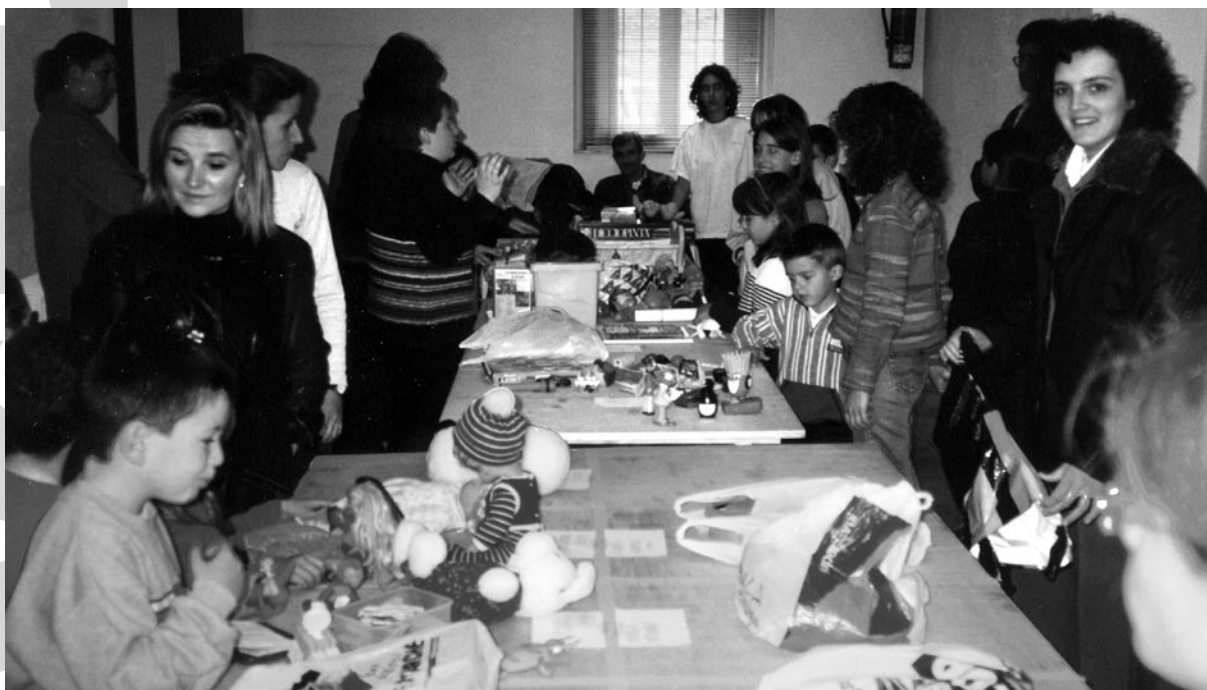
El Mercat boig de la joguina va tenir una bona participació.

Va tenir una bona participació. L'intercanvi de joguines entre els nens i nenes del poble es va preparar a can Gri i als baixos de l'Ajuntament, ja que dissabte a la tarda el temps no acompanyava per poder-ho fer a la plaça.