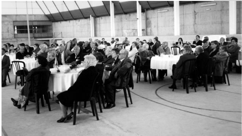
El dinar homenatge a la gent gran es va celebrar al pavelló poliesportiu.