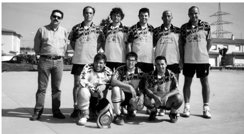
Restaurant Perelló, equip guanyador del 2n Torneig de Futbol Sala.