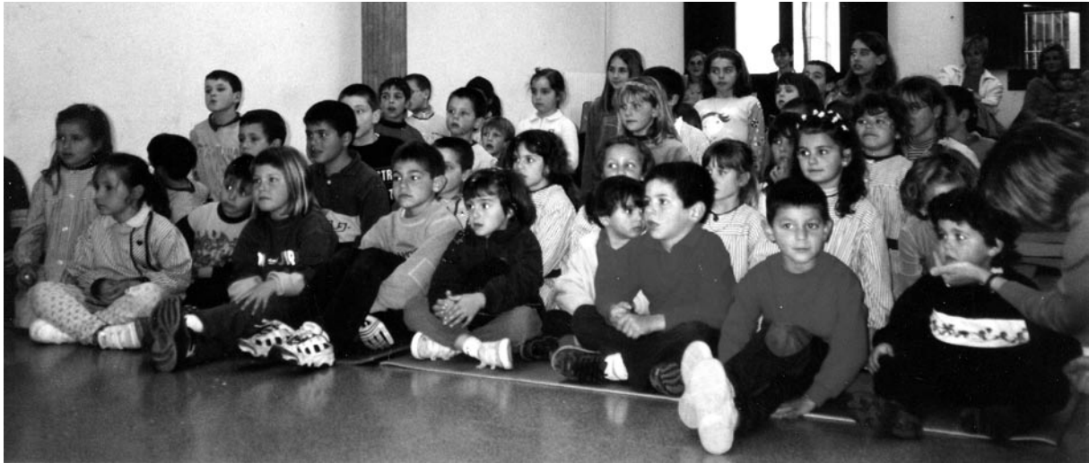
Els nens escoltant els contes del Teatret de Contes.