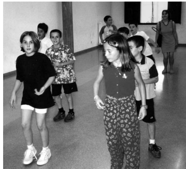
Nens i nenes que participen en les classes de ball que es fan els divendres a la ludoteca.

No volem acabar aquestes ratlles sense recordar-vos que la ludoteca tanca a finals de juny i torna a obrir a principis de setembre. Durant tot el mes de juliol hi haurà casal i el mes d'agost estarà tancada per vacances.