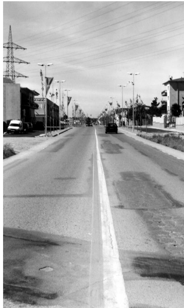
Les obres d'urbanització de les calçades laterals de la carretera de Santa Coloma.