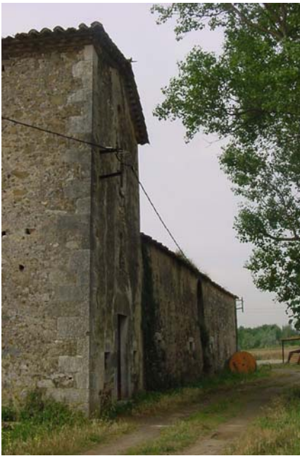
4.- CAN PERE MÀRTIR Façana nord-oest. Amb capella de Sant Pere a primer terme.