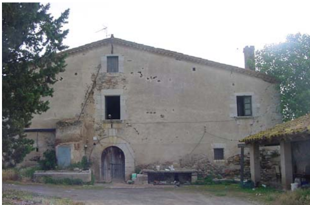
1.- CAN PERE MÀRTIR Façana principal (sud-oest).

de paraments exteriors podran practicar-se noves obertures, on la proporció entre buit i ple es mantindrà en un 85% a favor del ple i les noves obertures que es plantegin seran verticals en una proporció al menys de 1,66. El brancal extern de qualsevol obertura quedarà visible al menys en 22 cm de fons. El revestiment de façanes serà un netejat de la maçoneria, sense refondre junts o un rejuntat gras de calç sense refondre junts o un estuc o adreçat de calç, respectant els brancals i cantoneres carejats en recte o en escaleta. S'hi prohibeixen els envidraments reflectants d'efecte mirall, els tancaments de PVC i les persianes enrotllables.