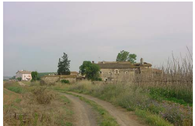
14.- CONJUNT DE CAN PERE MÀRTIR Des de llevant. A l'esquerra: cobertes exemptes prescindibles.