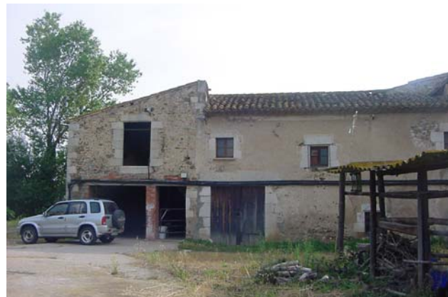
3.- CAN PERE MÀRTIR Façana principal (sud-oest). A l'esquerra: testa del cos nord-oest. A la dreta: cos que relliga la masia original i tanca el pati, originàriament obert.