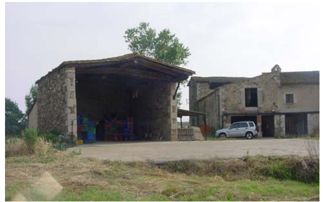
12.- CAN PERE MÀRTIR Paller o bastarral i la seva posició (el cos de rajoles que s'endevina darrera seu ha d'eliminar-se).