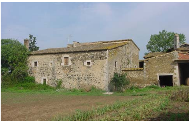
11.- CAN PERE MÀRTIR Façana sud-est. A la dreta: testa del cos nord-est amb obertures impròpies. Al centre: tancat del pati central, que pot eliminar-se. A l'esquerra: masia principal