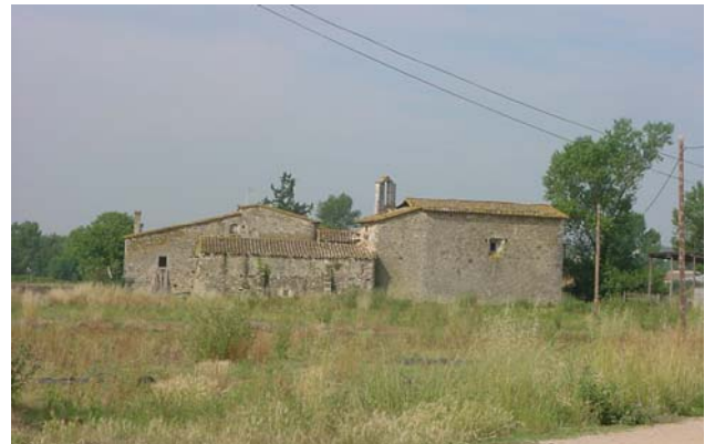
7.- CAN PERE MÀRTIR Façana nord-est. A la dreta: Capella de Sant Pere. Al mig: cos nord-est (cobert). Al fons: darrera de la masia principal.