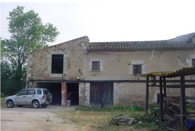
3.- Façana principal (sud-oest). A l'esquerra: testa del cos nord-oest. A la dreta: cos que relliga la masia original i tanca el pati, originàriament obert.