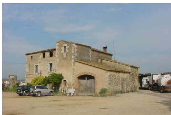
3.- Angle est.