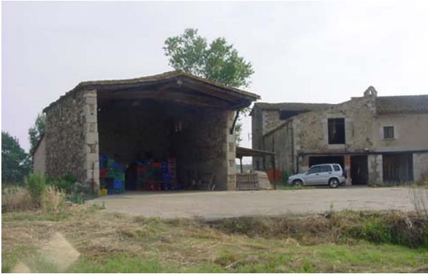
12.- Paller o “bastarral” i la seva posició (el cos de rajoles que s’endevina darrera seu ha d’eliminar-se).