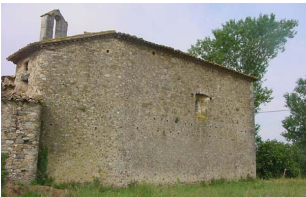
8.- Façana nord-est.

Al centre: tancat del pati central, que pot eliminar-se. A l'esquerra: masia principal