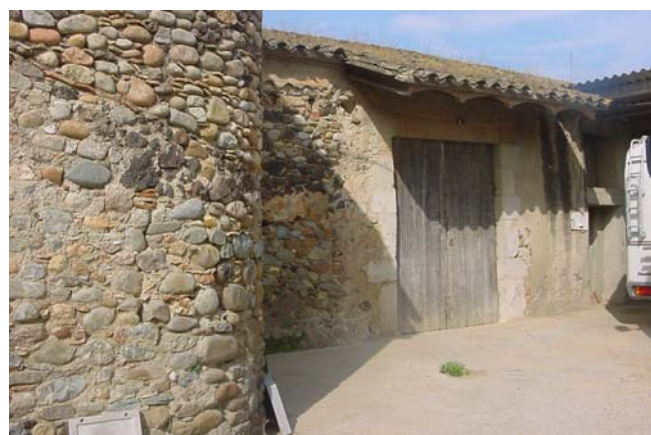
4.- Racó nord.