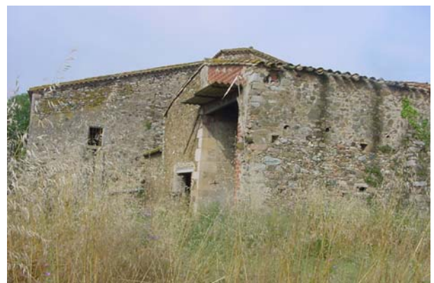
11.- Angle nord.