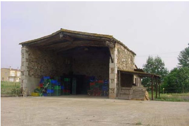
13.- Detall del paller o “bastarral”.