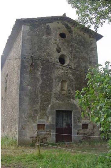
6.- Frontispici de la capella de Sant Pere.