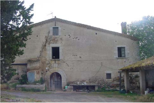
1.- Façana principal (sud-oest).