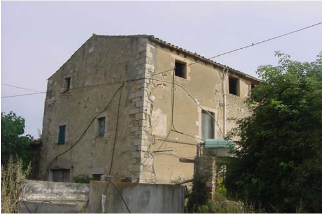
5.- Caire sud.