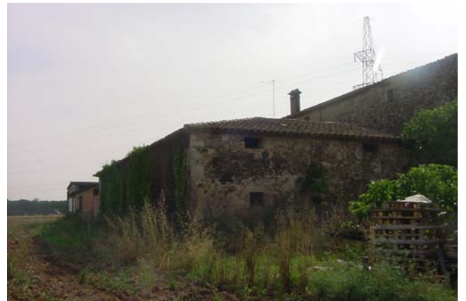
8.- Angle oest. Cossos envolvents del pati.