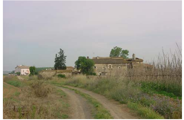
14.- Conjunt de Can Pere Màrtir Des de llevant. A l’esquerra: cobertes exemptes prescindibles.