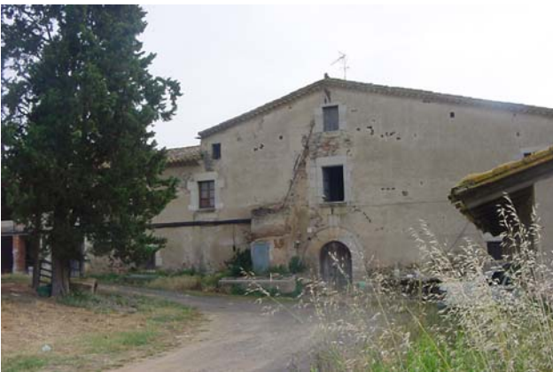
2.- Façana principal (sud-oest) A la dreta, cobert prescindible.