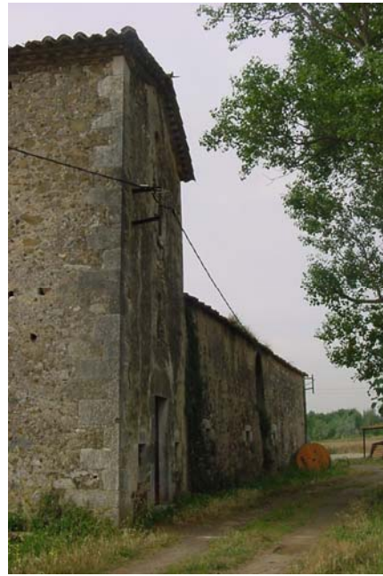
4.- Façana nord-oest. Amb capella de Sant Pere a primer terme.