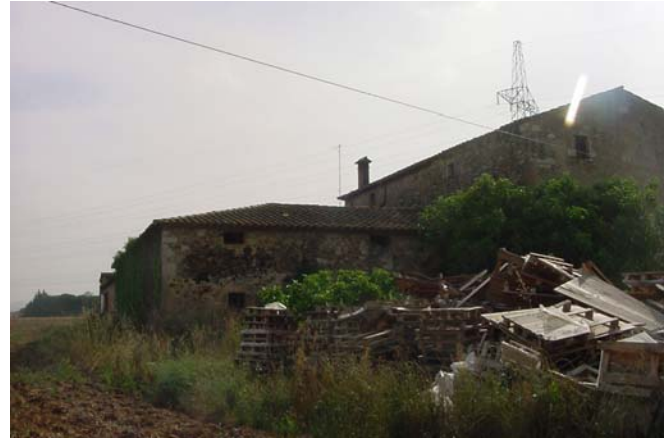
7.- Façana sud-oest. Cossos envolvents del pati.