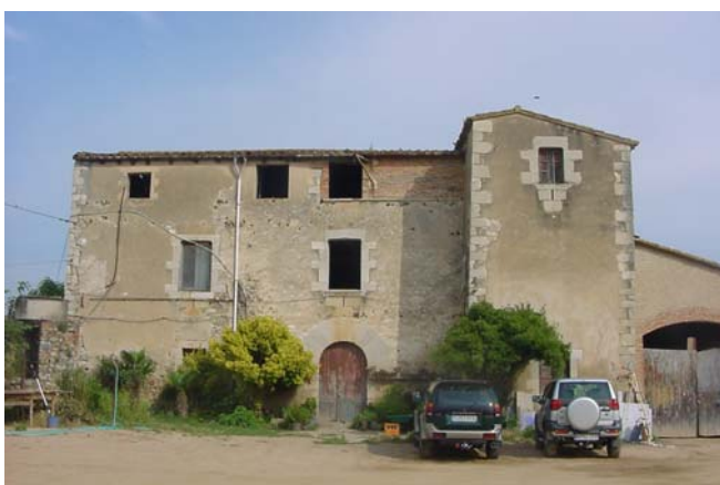
1.- Façana principal, cara sud-est.