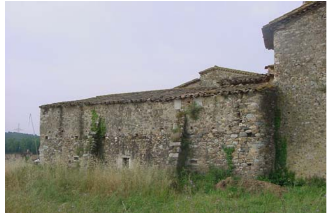
9.- Façana nord-est.