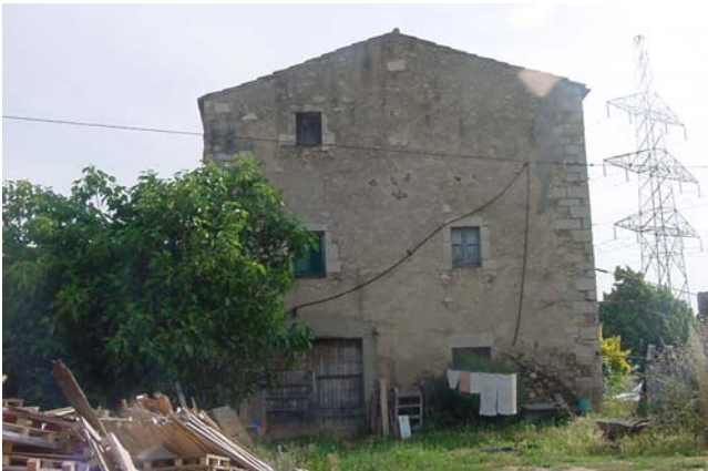
6.- Façana o testa sud-oest. A l'esquerra: portal impropri.