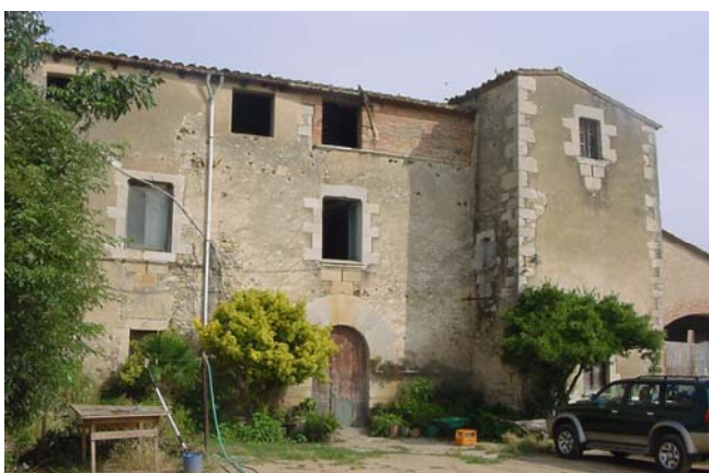
2.- Entrada i torre, façana sud-est.