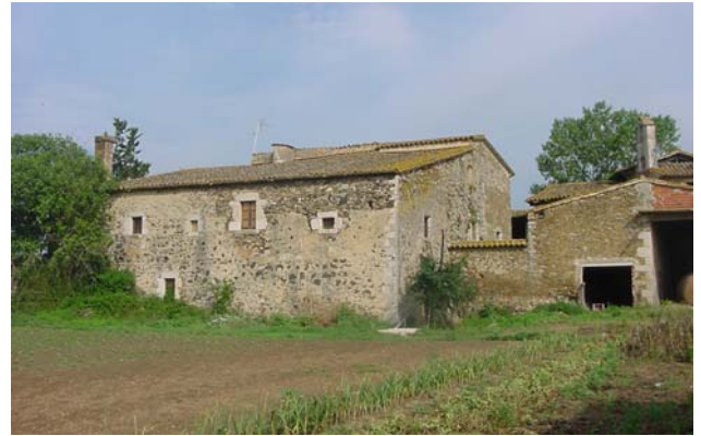
10.- Façana sud-est.

A la dreta: testa del cos nord-est amb obertures impròpies.