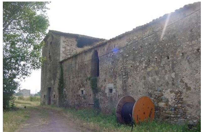
5.- Façana nord-oest. Amb cos nord-oest i capella de Sant Pere