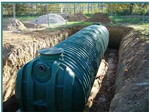
Dipòsit de polièster reforçat ubicat al costat del magatzem municipal