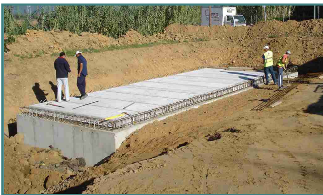
Dipòsit de formigó armat ubicat a les zones verdes del costat del pavelló municipal

L'Ajuntament de Vilablareix ha endegat un projecte de recuperació de les aigües pluvials. S'han construït dos dipòsits soterrats, un al costat del pavelló municipal i l'altre al costat del magatzem municipal. Aquests dipòsits recullen i filtren l'aigua que els hi arriba de la coberta de les dues instal·lacions municipals mitjançant un sistema de canals. L'aigua recuperada servirà per regar les zones verdes adjacents.