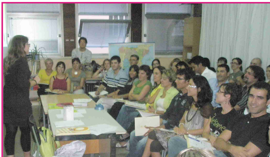
Jornada de presentació del curs

Davant la gran demanda (més de 50 persones es van inscriure), l'organització va desdoblar el curs en dos grups per atendre millor les necessitats dels alumnes: un grup, les tardes del dimecres, i l'altre, les tardes dels dijous, amb l'horari de 19h a 22h del vespre.