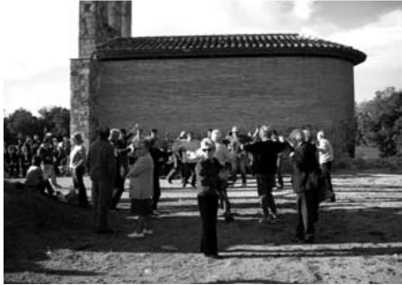
Sardanes a Sant Roc 2007 per Cobla Iluro

Seguint la tradició, el segon diumenge de Quaresma, que enguany s'escaigué el dia quatre de març, celebrarem el nostre conegut i típic Aplec de Sant Roc. Precedida i seguida d'altres actes festius, a les 12