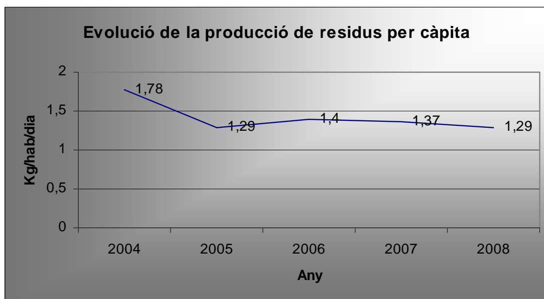
Gràfica 1: Evolució dels quilograms per habitant i dia entre els anys 2004 i 2008.

Durant l'any 2008 s'han recollit a Vilablareix 1.074,54 tones de residus, la qual cosa representa aproximadament un 5,8% menys que l'any 2007. Cada habitant ha generat 1,29 kg de residus al dia . Si comparem aquesta dada amb els quilograms recollits per habitant i dia entre els anys 2004 i 2008 obtenim la següent gràfica.